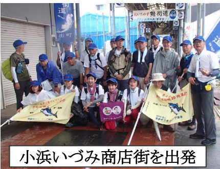
小浜いづみ商店街を出発

熊川宿や瓜割の滝などに歴史を感じ、そして天然の美味しさを味わえた素晴らしい二日間でした。一日目45 分 、二日目35 分 を完歩出来、本当に嬉しかったです。人生初の旗持ちウォークを経験し、情熱と笑顔で無事ゴール出来ました。これもひとえに協会スタッフの絶大なるサポートの賜物と感謝申し上げます。次回は、「針畑越え」にチャレンジいたしたく、よろしくお願いします。