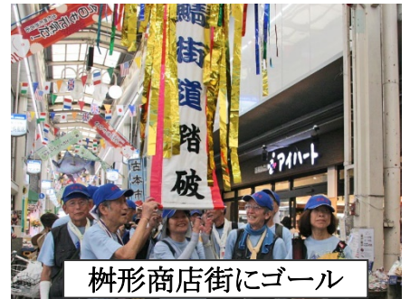
榊形商店街にゴール