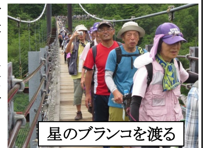
星のブランコを渡る

7月7日、まさに七夕の日、七夕伝説発祥の地「交野」を巡りました。JR河内磐船駅を出発、七夕祭りの参拝客で大賑わいの星田妙見宮に到着しました。七夕伝説の解説パネルも掲示されている境内をぐるりと見学、祀られていた茅の輪くぐりも体験しました。その後、急な山道に入り、息を切らせて登坂、やまびこ広場に到着、昼食休憩としました。午後は星のブランコに挑戦、構造はしっかりしているようですが、団体で歩行するとかなりの横揺れが発生し、肝を冷やしている方も多数みられました。やっと渡り終え、ピトンの小屋で休憩。天の川沿いの山道を下り、磐船街道を経て京阪河内森駅にゴールしました。